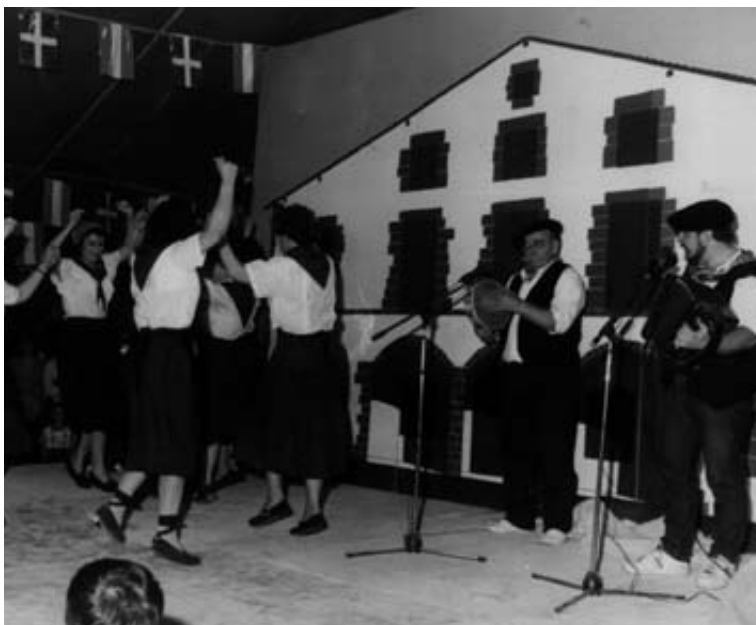
Colectividades actuación de "Txilibrin» (Alboka, Pandereta y Etxeberria).

Zazpirak-Bat participa del Primer Congreso Americano de Centros Vascos en Buenos Aires.