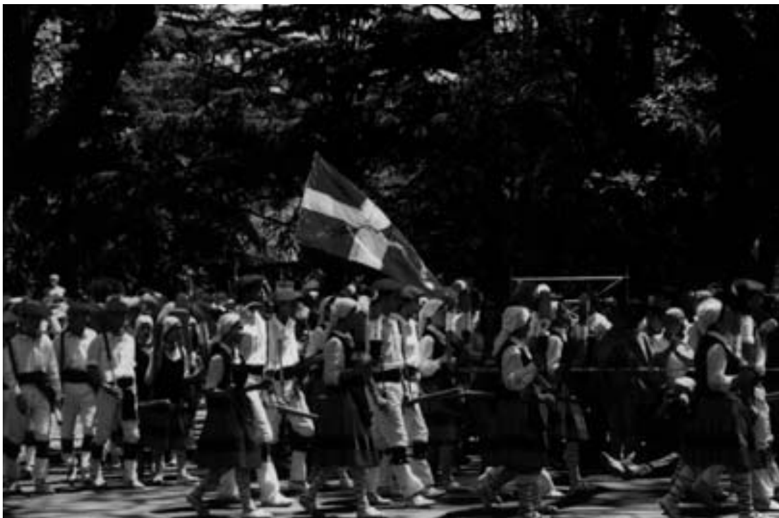
Semana Nacional Vasco-Argentina. Rosario. 14 al 20 de octubre de 1996.

distintas publicaciones de notas referidas a la situación en Euzkadi, conmemoración de fechas y acontecimientos que hacen a la historia de los Vascos, notas sobre el significado de las distintas festividades, como por ejemplo el Aberri Eguna, San Ignacio, San Prudencio, etc. Además como en anteriores publicaciones realizadas desde el centro encontramos poesías, canciones, cocina vasca, etc.