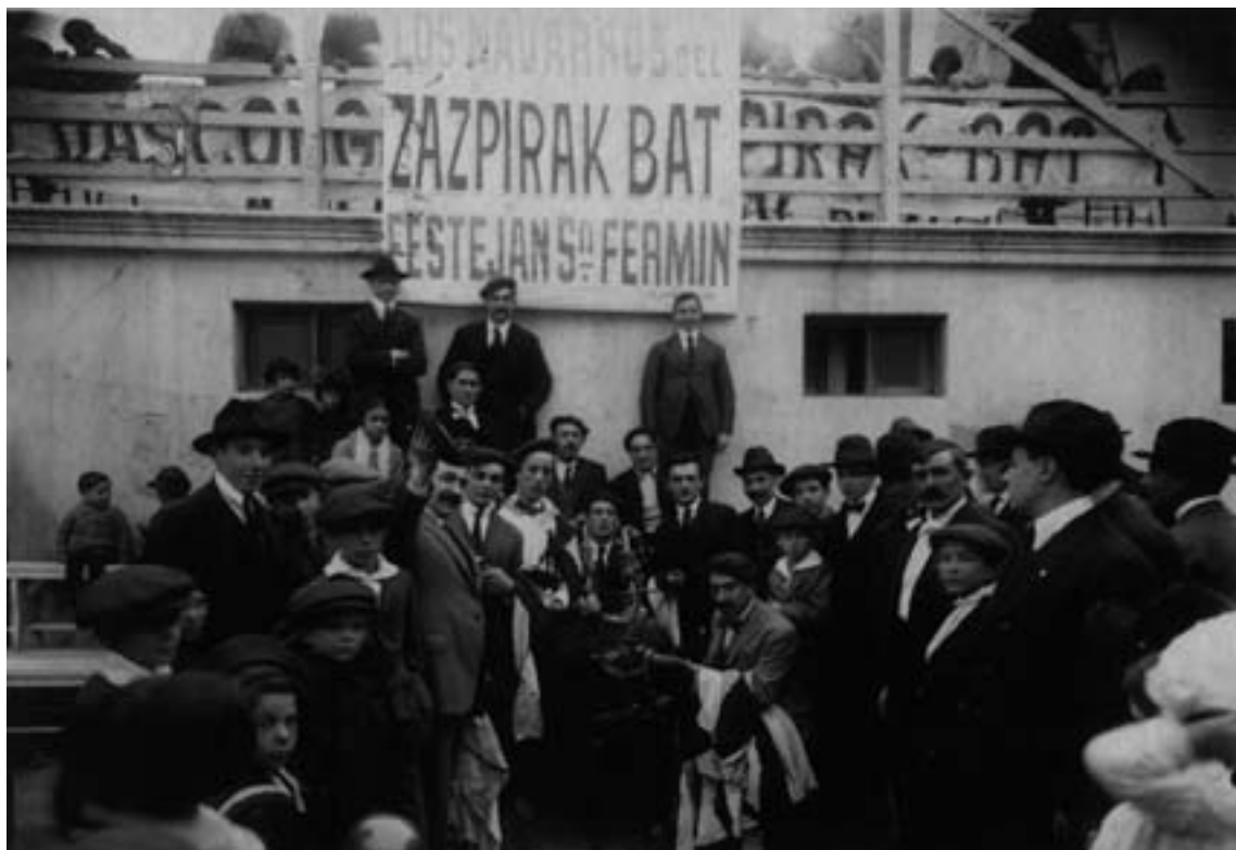
Los navarros del Zazpirak-Bat festejan San Fermín. 1930.

una clara definición en favor de una identidad institucional que, a pesar de ser por ciertos socios vituperada y en ocasiones rechazada al punto del alejamiento de algunos de ellos, igualmente cristalizaba el sentir de muchos de los vascos que residían en Rosario y que en ocasiones lo expresaban concretamente o que, de una forma o de otra, prestaban su aquiescencia.