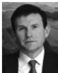
JUAN JOSÉ IBARRETXE MARKUARTU Lehendakari