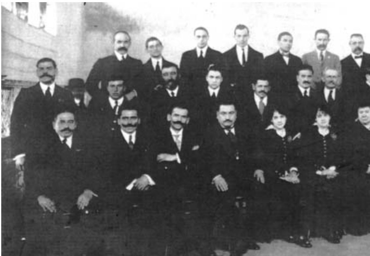
Primera Comisión Directiva. 1912.