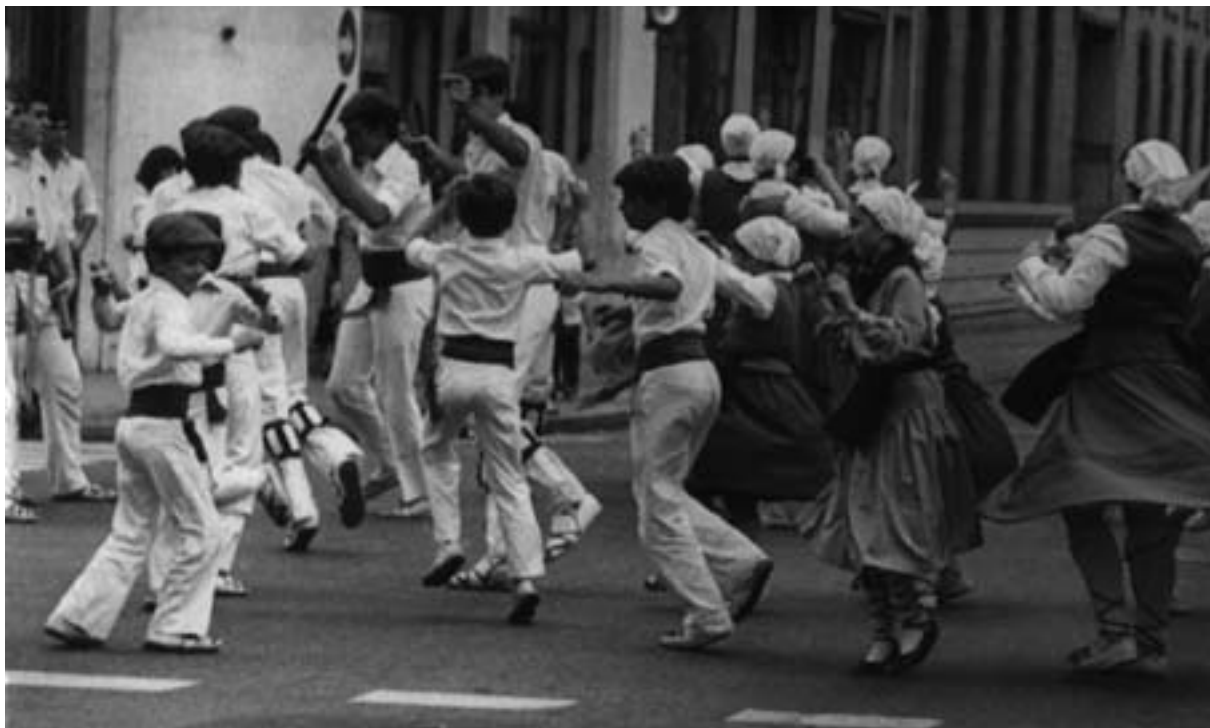
Aberri Eguna 1980. Rosario. abril 6 de 1980.

Recorrer la historia institucional del Zazpirak-Bat en los años correspondientes a la década del '80 significa encontrarnos con un arco que, al abrirse, nos pone frente a cuestiones de diferente índole, de las cuales ninguna muestra rasgos de irrelevancia. Esta década viene a presentarnos el funcionamiento de una institución plenamente solidificada –ya desde hace tiempo–, que ha encontrado un claro lugar como tal: representar la patria... (re)construir la patria. Pero también, esta década, nos muestra el