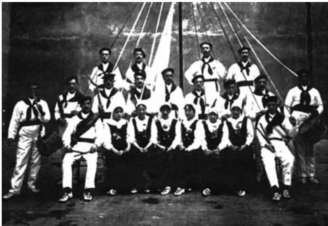
Primer Cuadro de Euzpatadantzaris del Centro Vasco Zazpirak-Bat, 1913 en San Ignacio.

firme esperanza de la patria, se da cita en los aledaños de la ermita y a su vela baila alegre y confiada la armoniosa sinfonía de su fandango y ariñ ariñ” 71 .