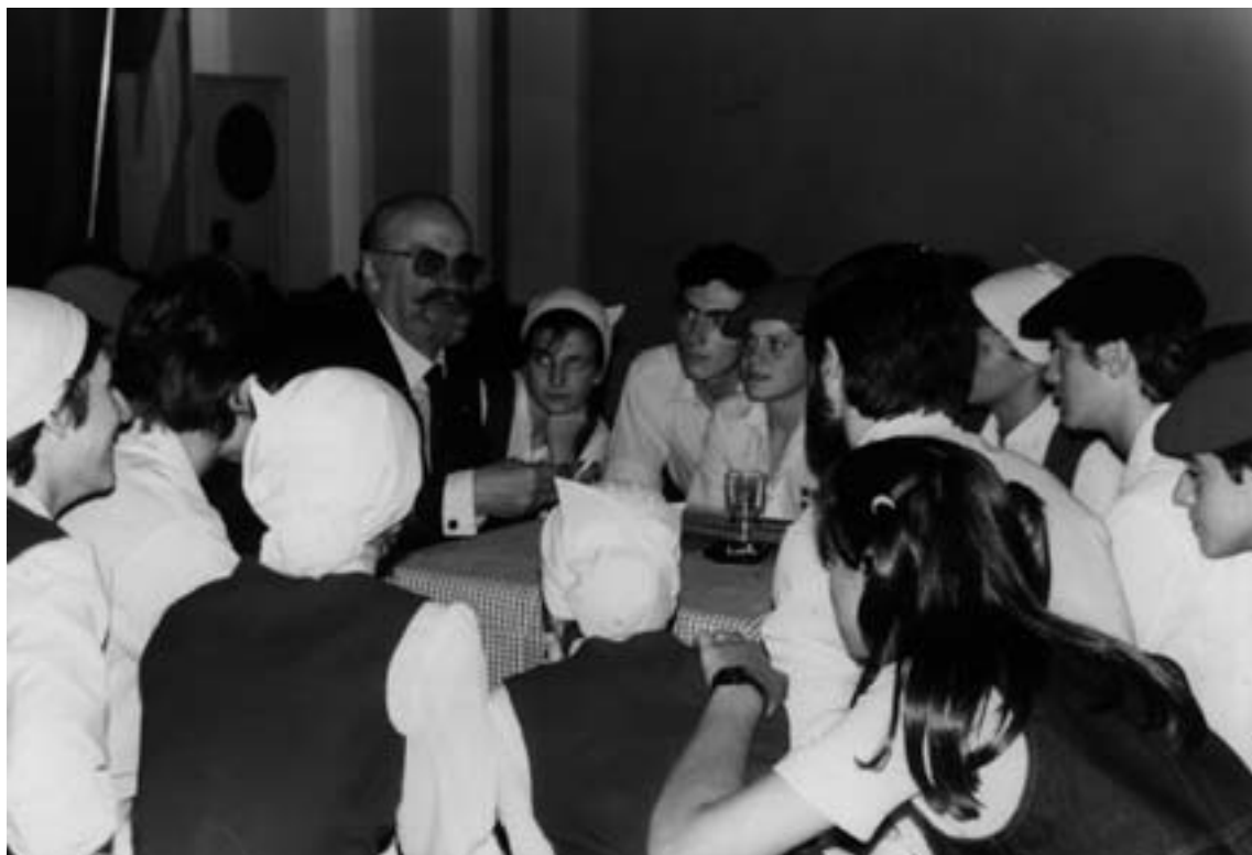
Senador Joseba Elosegi con jóvenes de la institución. 1988.

También debemos mencionar que el año 1985 es cuando por primera vez se celebra, en la ciudad de Rosario, el Encuentro de Colectividades. No obstante, debemos agregar que, para el Centro Vasco esto no es relevante ya que en esa ocasión deciden no participar.