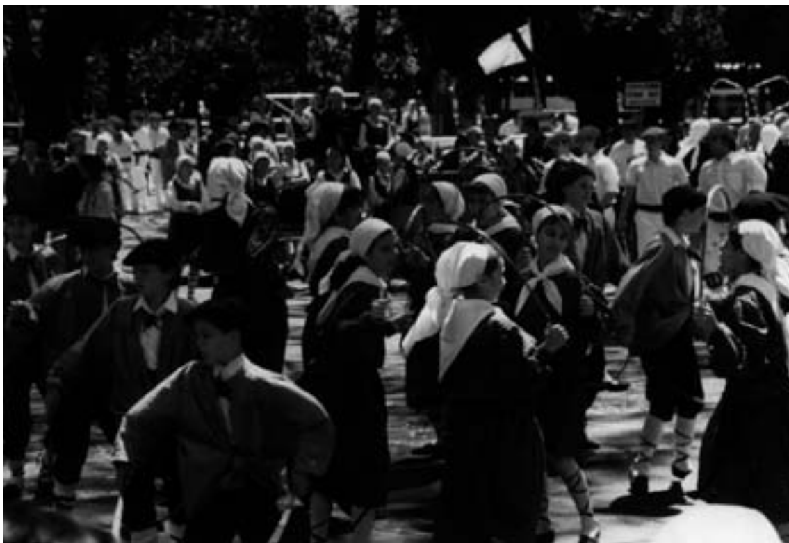
Semana Nacional Vasco-Argentina.