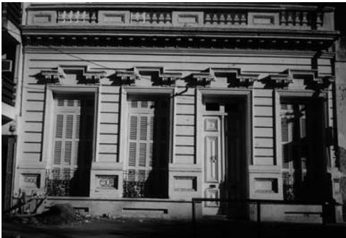
Local Zazpirak-Bat entre 1924 y 1938. Calle Laprida.