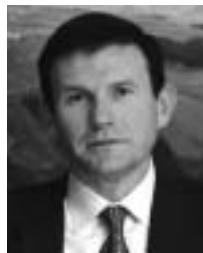
JUAN JOSÉ IBARRETXE MARKUARTU Lehendakaria