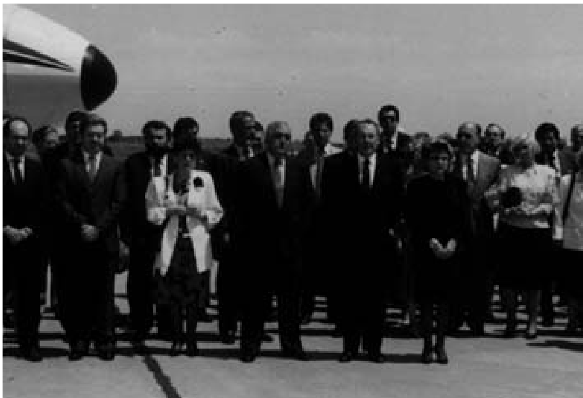
Visita a Rosario del Lehendakari José Antonio Ardanza. Año 1988.