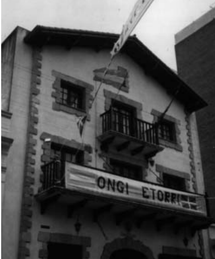
Septiembre 1987. Centro Basko. Zazpirak Bat - Rosario.

lugar de puja de decisiones que afectaban la dirección del centro, un grupo cuyos miembros ejercían funciones comunes en el contexto determinado por el espacio de la sede vasca.