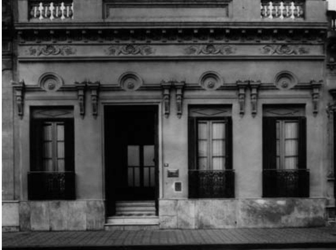
Compra Sede Calle Entre Rios 261. Año 1939.

Europa. Pero esto no menguó las fuerzas de los vascos de esta ciudad. Por el contrario, de allí en más, veremos redoblar esfuerzos por parte de quienes habían logrado trasladar las cenizas para que el resurgimiento se diera lejos de Euskadi, pero siempre allí.