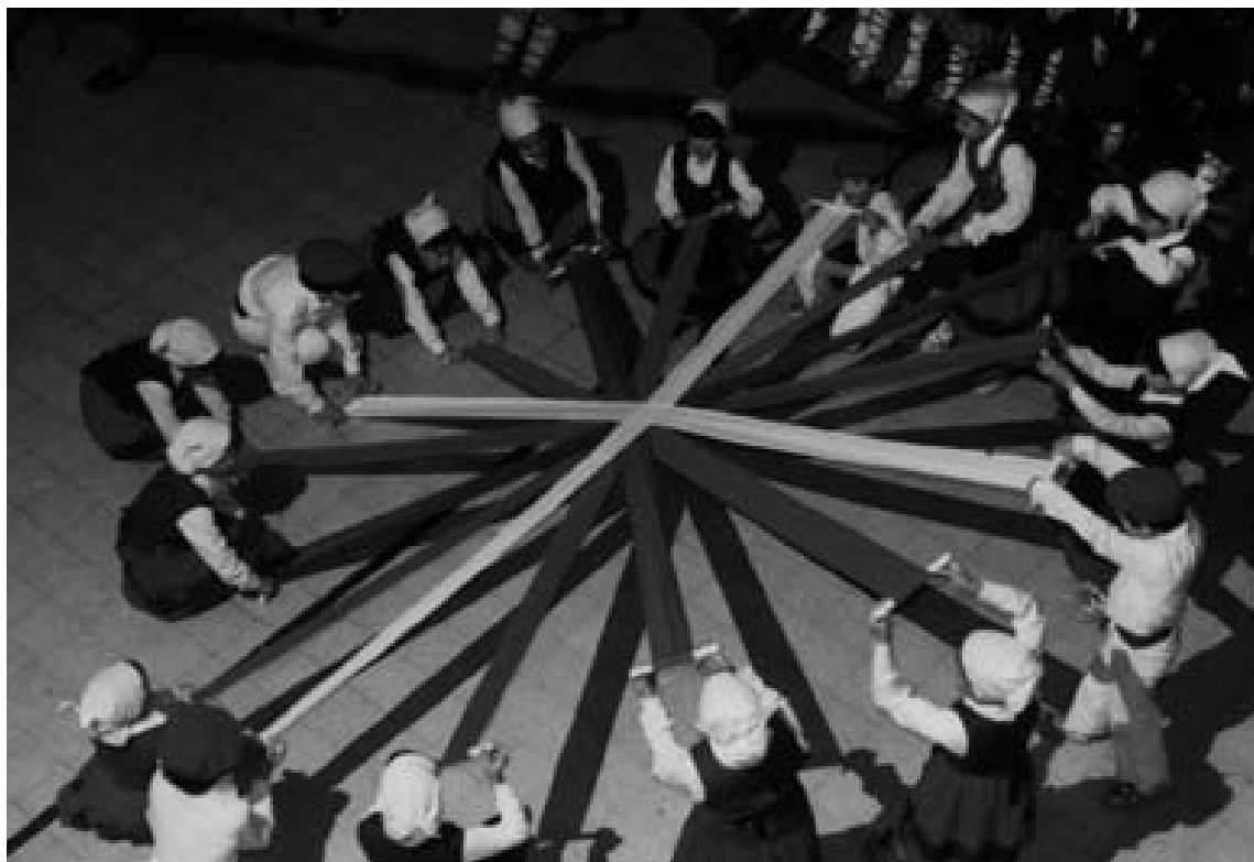
Cinta Dantza. Cuadro Txiki.

Para los grupos reunidos en torno a la publicación Acción Nacionalista Vasca , el nacionalismo era la única esperanza que tenían para lograr escapar de la esclavitud a la que ciertas naciones le obligaban a vivir o pretendían hacerlo. Es un arma para defenderse contra los ataques que les dirigen distintas razas.